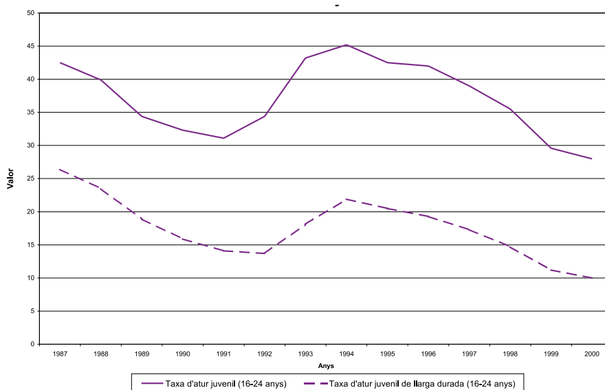
Gràfic 1. Taxa d'atur juvenil (16-24 anys), per durada. Catalunya